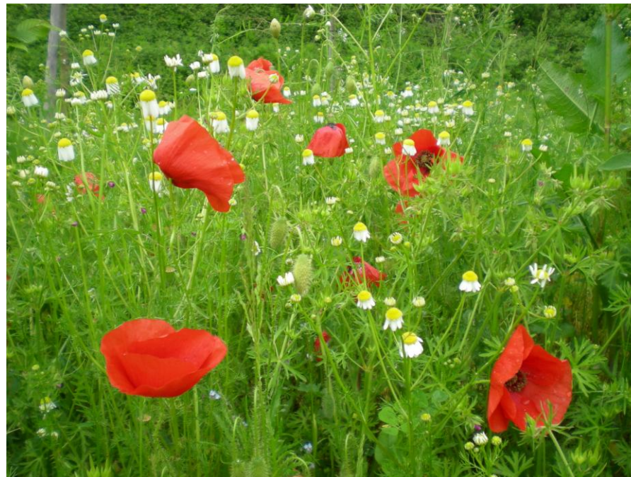
Valmuer og margueritter