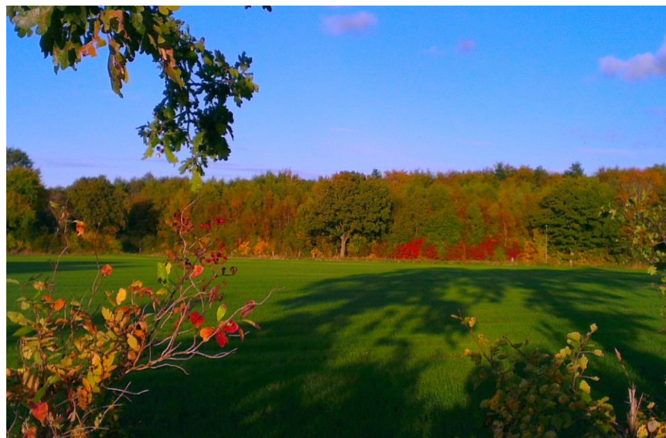
Efterår over Kollund