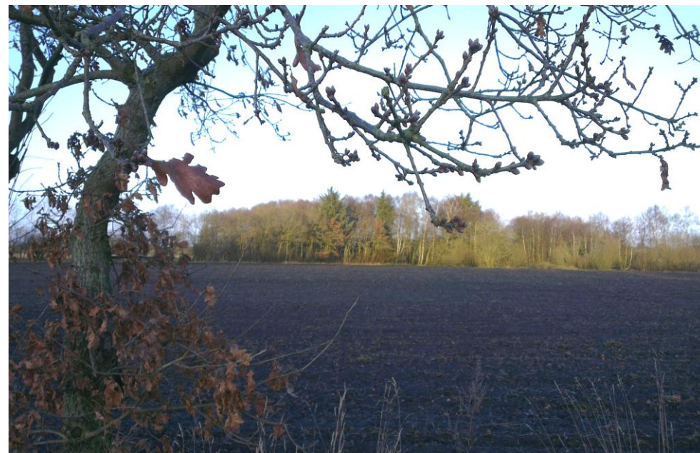
Mark udenfor Kollund